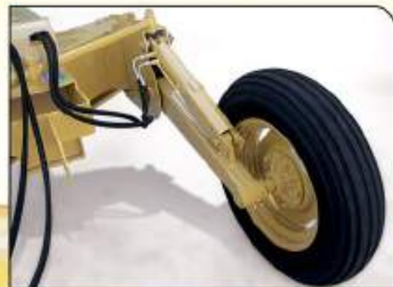
Traba de seguridad manual para transporte.