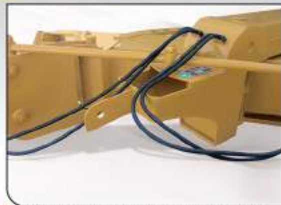
Alojamiento para contrapesos opcionales.