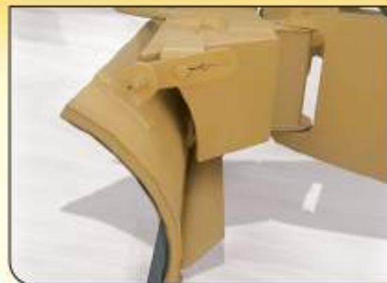
Regulación manual de ataque de vertedera.