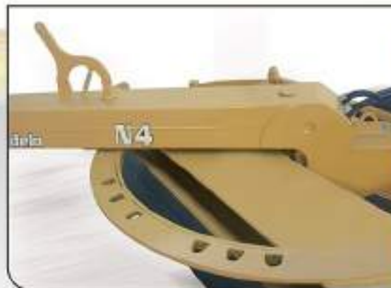
Rotación manual de vertedera con 9 posiciones de trabajo.